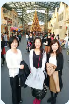
東京ディズニーランドにて 表彰セミナー参加