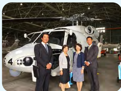
海上自衛隊館山航空基地開隊記念式典