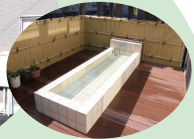
日当たりの良い足湯